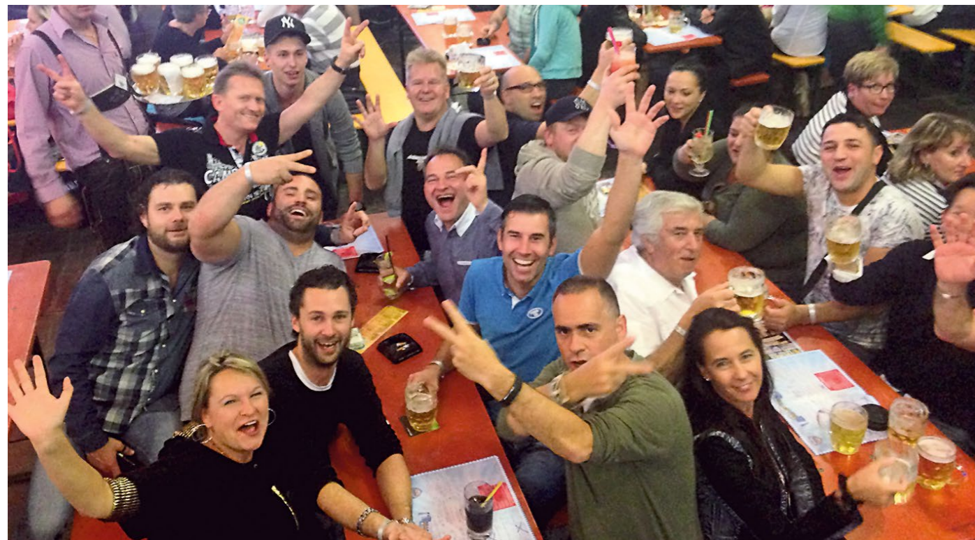
Von einem ganz speziellen Highlight sprechen die Zengaffinen-Mitarbeiter noch heute: Im Herbst 2015 reiste Zengaffinen mit seinen Mitarbeitern nach Mallorca.

40 Jahre ZENGAFFINEN Die grüne Kältetechnik